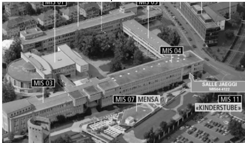
Université Miséricorde, MIS04 4112, Salle Jäggi

Einführungssitzung für neue Philosophiestudierende Mittwoch, 21. September 2016, 17.15 Uhr